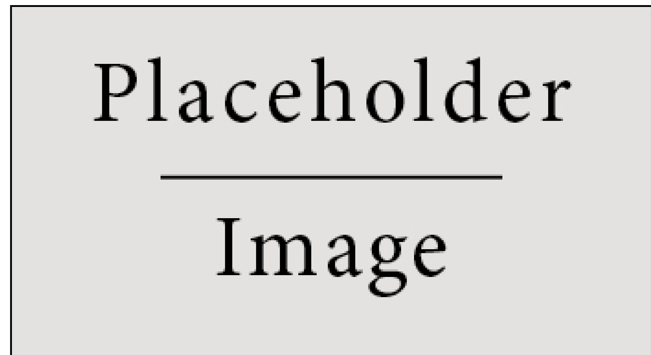
Figure 2: Figure caption

Vivamus sed nibh ac metus tristique tristique a vitae ante. Sed lobortis mi ut arcu fringilla et adipiscing ligula rutrum. Aenean turpis velit, placerat eget tincidunt nec, ornare in nisl. In placerat.